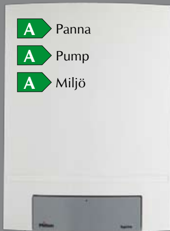
TopLine 15, 25, 35 och 45