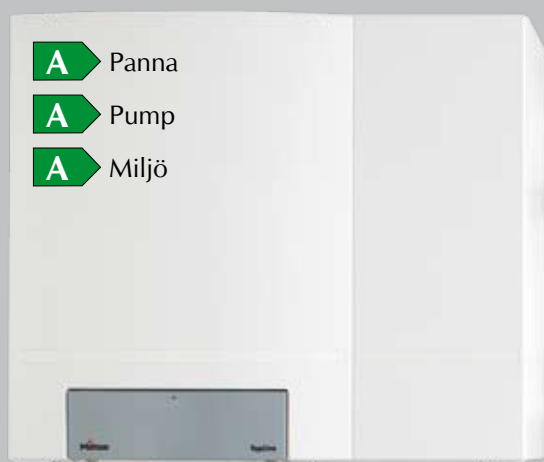
TopLine 25 Combi