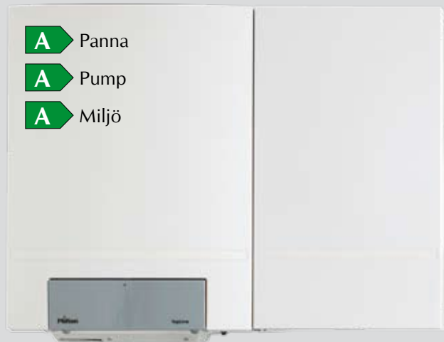
TopLine 15, 25, 35 och 45 med beredare