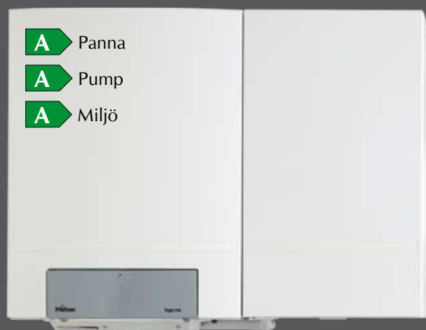
TopLine 25 Combi Plus